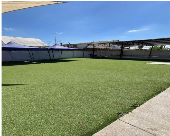
Fotografía Zona de Seguridad