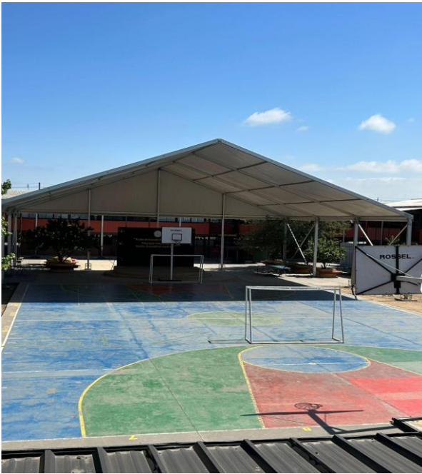
Fotografía Zona de Seguridad